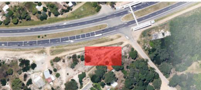
Escuela 294 jaureguiberry

Con una poblacion no mayor que 500 personas este balneario, posee un clima calido templado, lloviendo incluso en en mes mas seco.