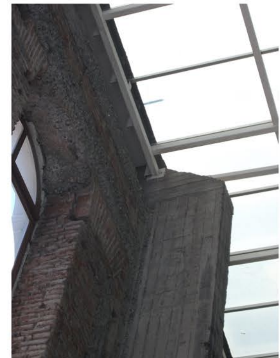
DETALLE PILAR H.A. Y PERFILES METALICOS