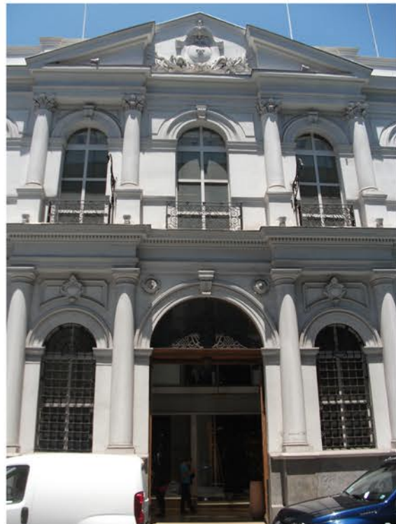
VANOS DE LA FACHADA NORTE