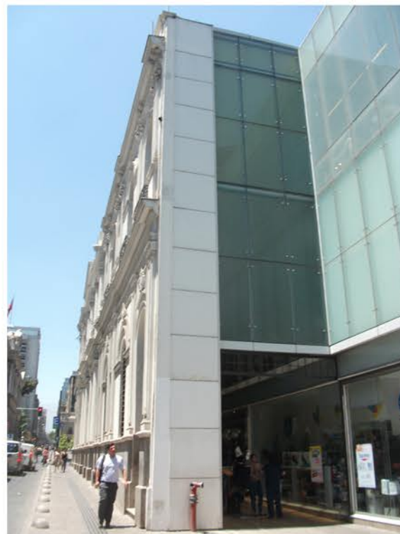
ACCESO PASILLO FACHADA NORTE