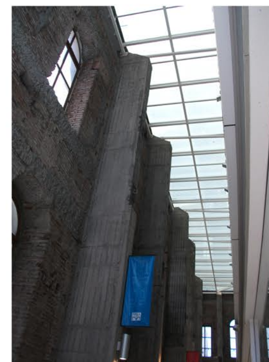
PILAR ESTRUCTURAL DE HORMIGON