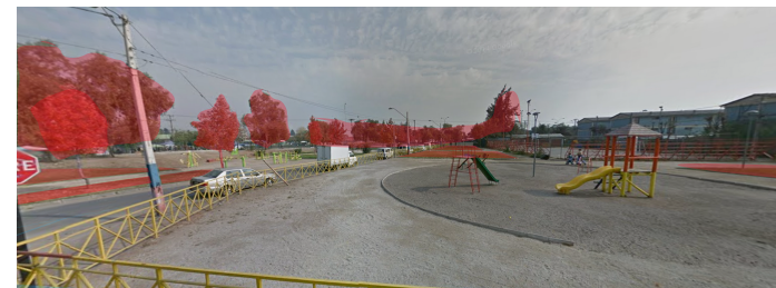
Google maps 2014