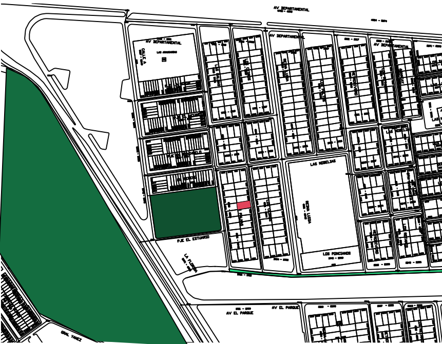
Catalogo Arquitectura 2020