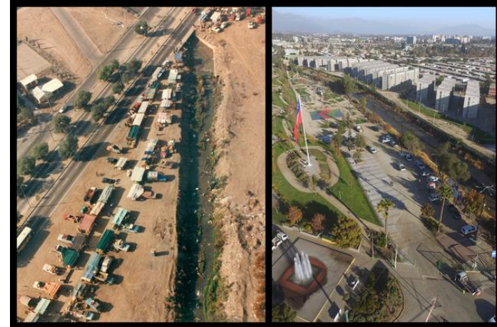
Municipalidad de La Florida 2018

En la comuna de La Florida, específicamente en la Villa Las Araucarias el injerto verde urbano se hizo fuertemente presente. Años atrás existía un peladero el cual se intervino de 2 formas, construyendo un parque llamado Eduardo Frei Montalva y a su vez construyeron un comité de allegados con personas de diferentes comunas. Cerca de mi hogar pasa un caudal el cual debido a la humedad que se eleva se fue creando en sus alrededores áreas verdes, por otro lado en el pasaje lateral se ubica una plaza especialmente acompañada de una cancha de futbol. Los lugares ya mencionados son los espacios con más potencial de áreas verdes en mi sector.