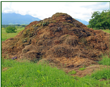
Usamos la maleza y los restos

Lo mejor es no tratarlos como basura y mejor como abono ya que traen muchas propiedades positivas para la tierra