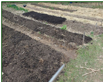
Se excava y se mezcla

Nuestro principal metodo es trabajar en base a reducir ya que logramos: