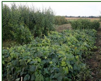
Plantar 100% organico