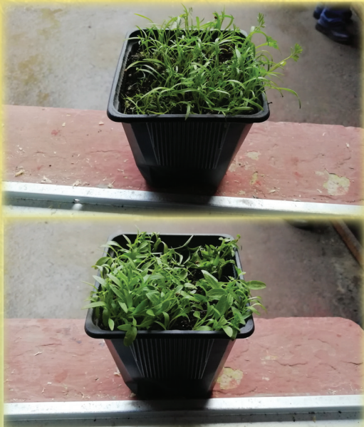
Plantas de Zanahoria y Perejil Autor: Luis Castro