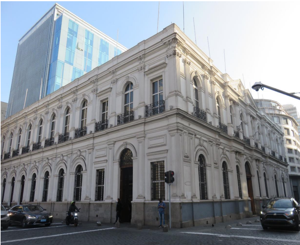
Revista AUS 11_Espacio M_G