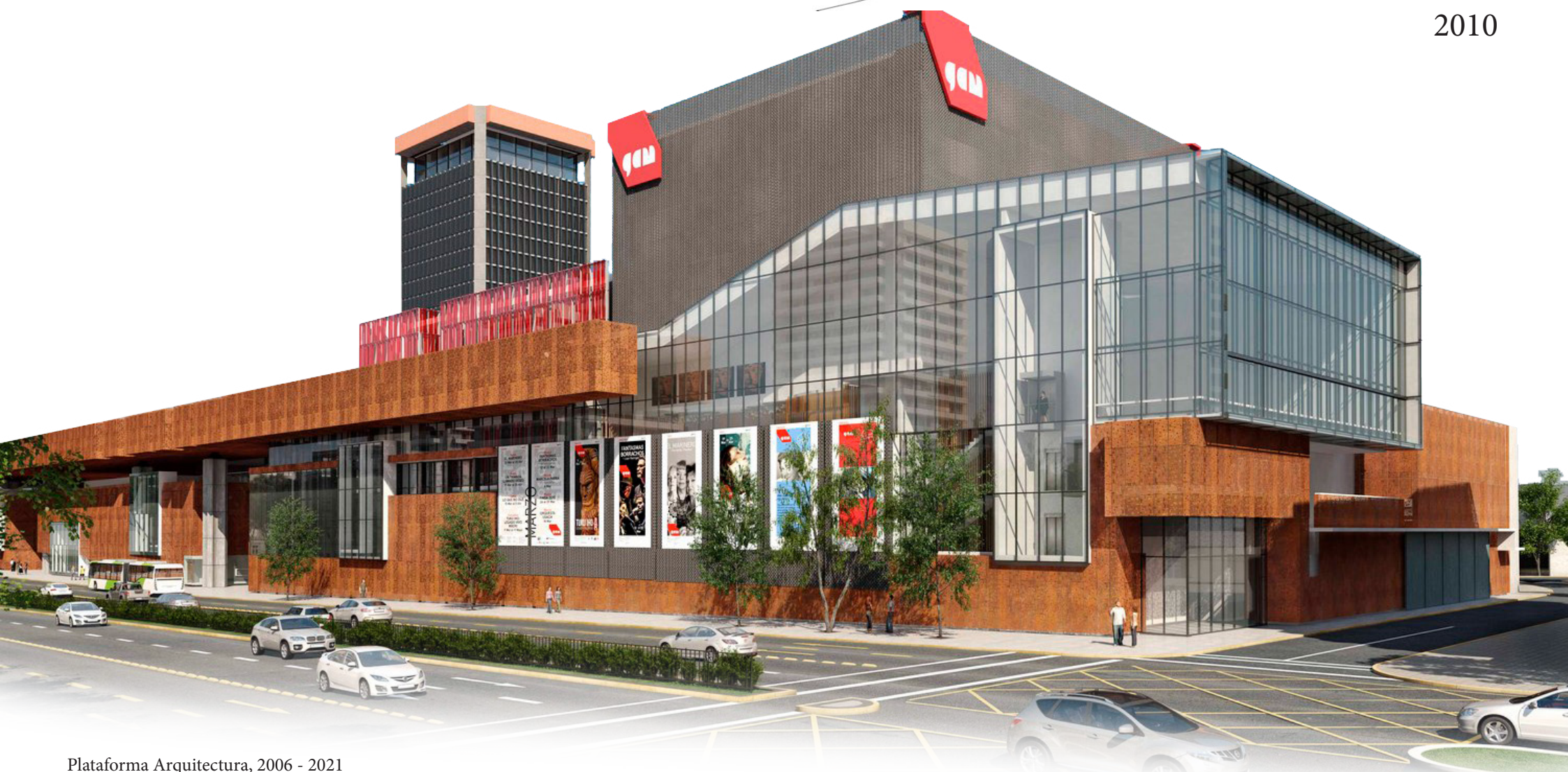
Plataforma Arquitectura, 2006 - 2021